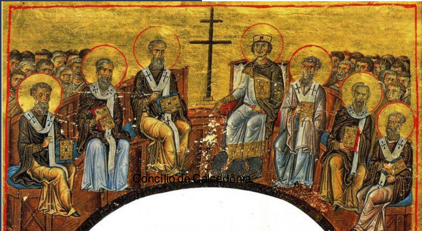
Concílio de Calcedônia